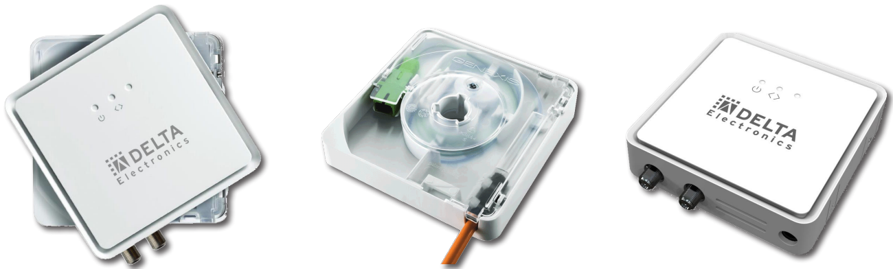
Unterteil zur Wandbefestigung - OFTU (Art.-Nr. 57003555)